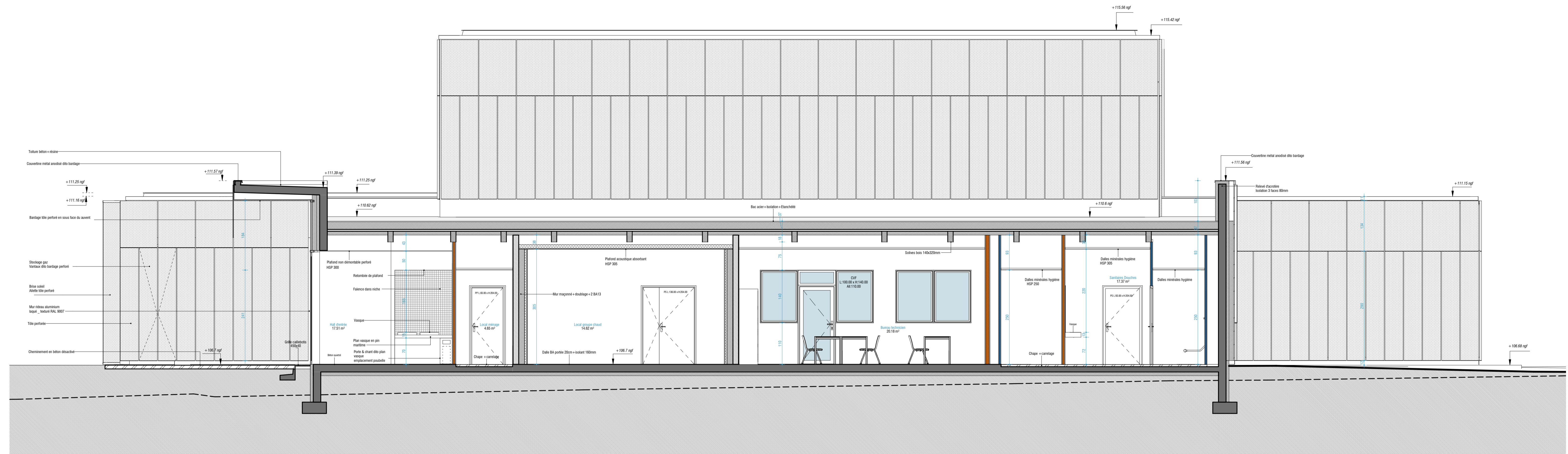
COUPE LONGITUDINALE CC'