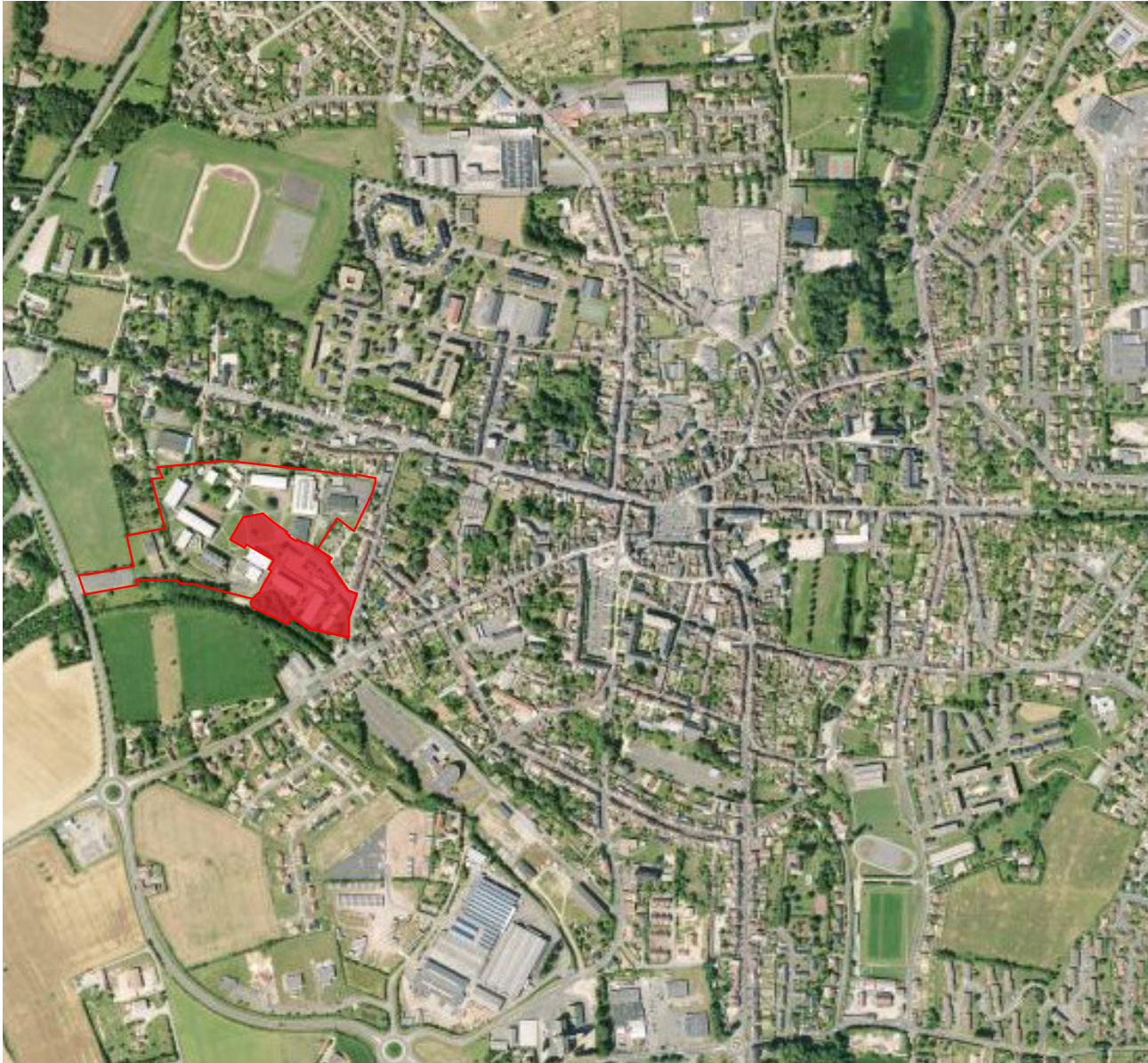
Plan de situation _ 1/10 000 ème